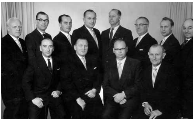
Vorstand 50 Jahre

Höhepunkte der Festwoche waren der Jubiläumsakt im Schützensaal sowie Jubiläumsspiele verschiedener, teils höherklassiger Mannschaften.