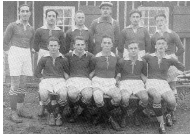
Mannschaft Stockbrunnen 1927

In diesem ersten Jahr in der Kreisklasse belegten die Oberndorfer nach der Vorrunde den 6. Tabellenplatz, am Schluss der Saison lagen sie punktgleich mit Radolfzell auf Rang 9.