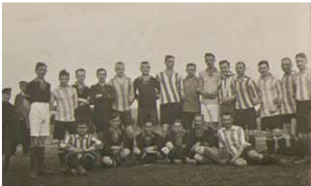
Propaganda-Spiel Stuttgarter Kickers

Auch im Pokal schlug man sich wacker, erst nach mehreren Runden musste man sich schließlich dem Gauligsten FC Stuttgart mit 3:4 Toren nach Verlängerung geschlagen geben.