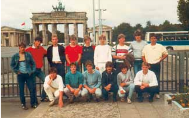
A-Jugend 1985 Berlin