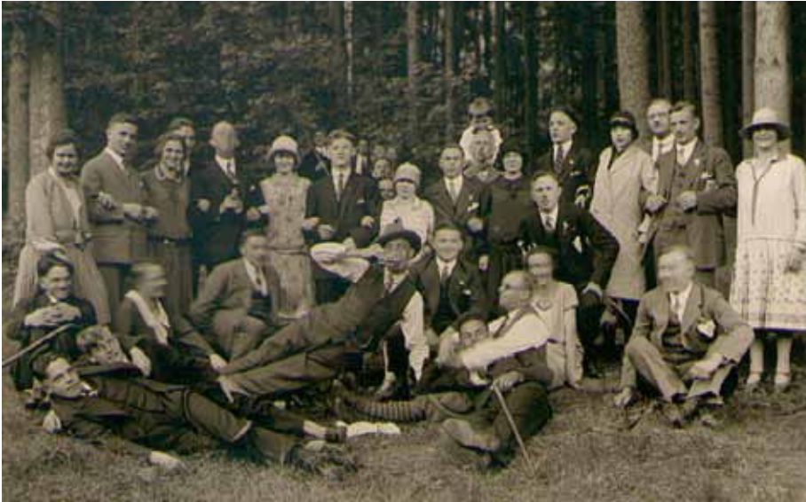
Ausflug 1921 nach Freiburg