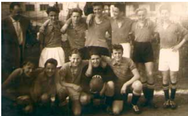
B-Jugend Titelgewinn 1956