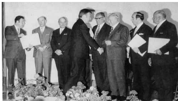
SVO 60 Jahre

Nach dem Ende des Spieljahres 1970/71 wurde das 60jährige Jubiläum gefeiert. Höhepunkte waren ein Festakt im Bonhoefferhaus und ein Festabend in der Brauereihalle.