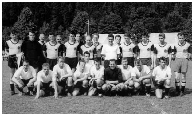
50 Jahre Jubiläum Schramberg-Schwenningen

Somit konnte der größte sportliche Erfolg in der Vereinsgeschichte zeitgleich zum 50jährigen Bestehen der SVO gefeiert werden.